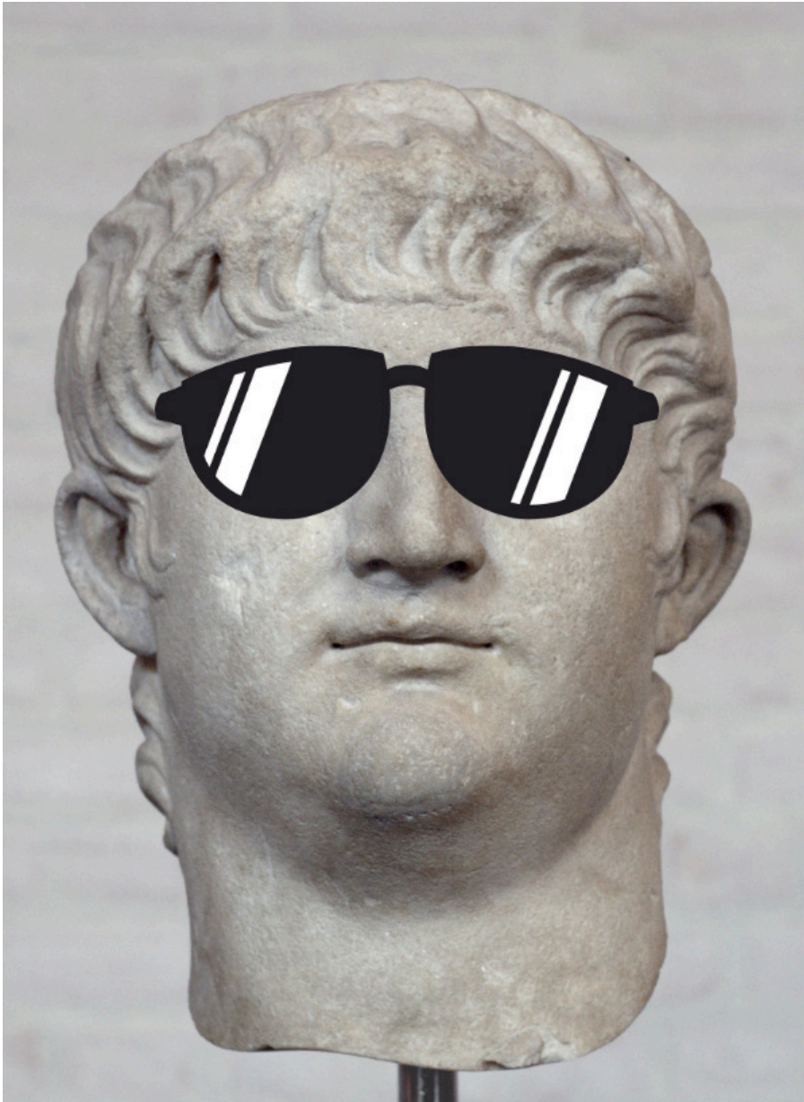
Nero - ein Trendsetter? (Bildquelle 3 )

Im Mittelalter gab es erste Vorläufer, die aber eher wie Lupen funktionierten: sogenannte Lesesteine, die auf der einen Seite gewölbt waren und zur Vergrößerung auf die Bücher gelegt werden konnten. Die waren noch nicht aus Glas, sondern aus einem Mineral namens Beryll - ihr dürft nun raten, woraus sich das Wort „Brille“ entwickelt hat... Das Wissen über die Wirkung solcher Steine stammt aus dem 1021 von dem arabischen Mathematiker Ibn al-Haitem verfassten Buch Schatz der Optik und wurde der westlichen Welt Ende des 12. Jahrhunderts bekannt, als Mönche das Werk ins Lateinische übersetzten. 4