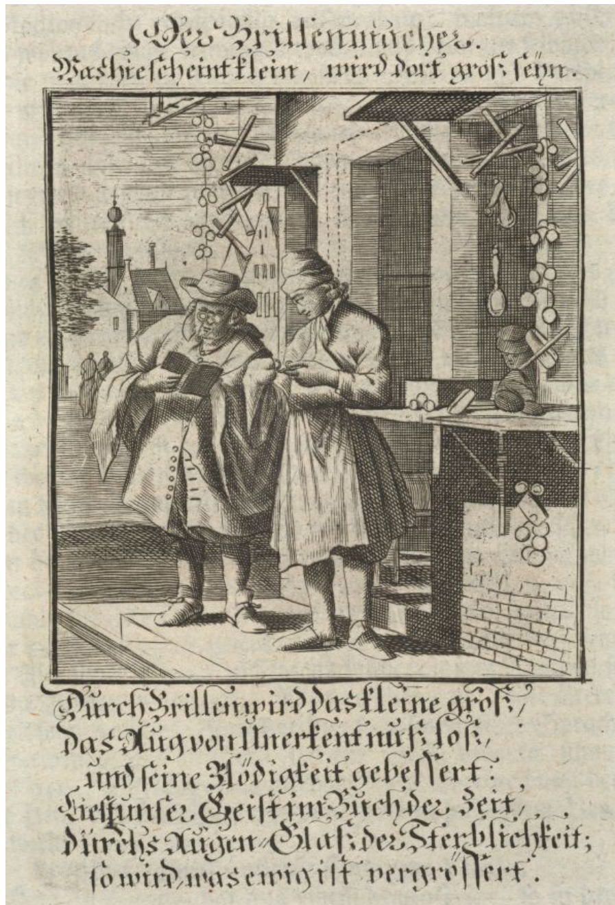
Das Geschäft eines Brillenmachers, Kupferstich von 1698. (Bildquelle 13 )

Trotzdem blieb das Brillentragen natürlich der gelehrten Elite vorbehalten und stellte damit auch ein Statussymbol dar. Nach der Erfindung des Buchdrucks um die Mitte des 15. Jahrhunderts stieg die Nachfrage aber dennoch stark an, und bis heute sind viele Darstellungen von Brillenträgern erhalten. Die Benutzung der Nietbrillen blieb trotzdem etwas umständlich, da sie auf manch einer Nase keinen richtigen Halt hatte und immer noch zumindest mit einer Hand fixiert werden musste.