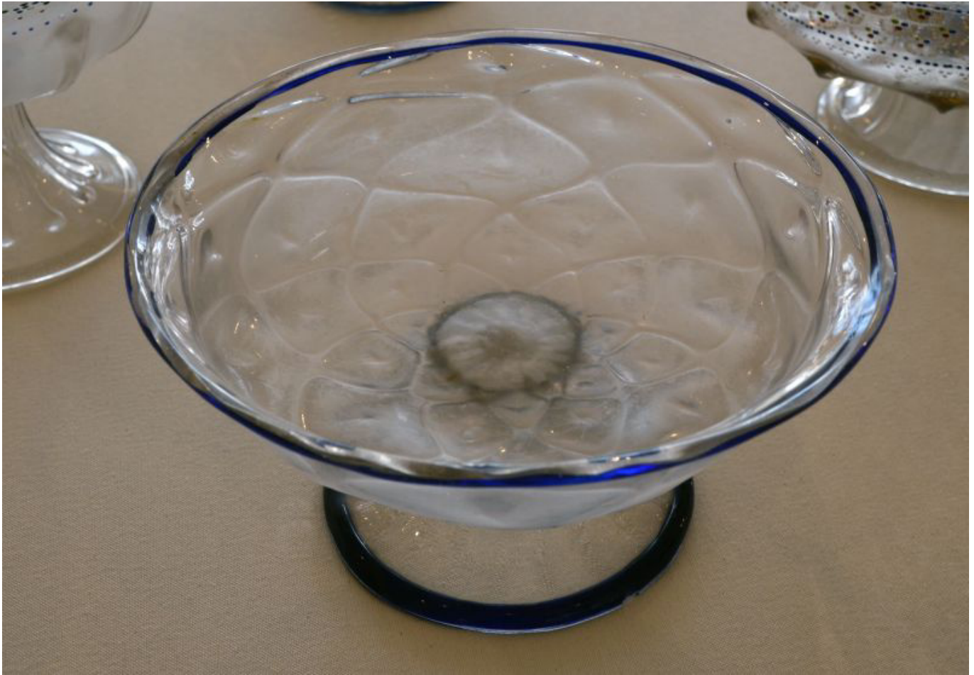
Durchsichtiges Glas aus Murano bei Venedig, hergestellt um 1500. (Bildquelle 6 )