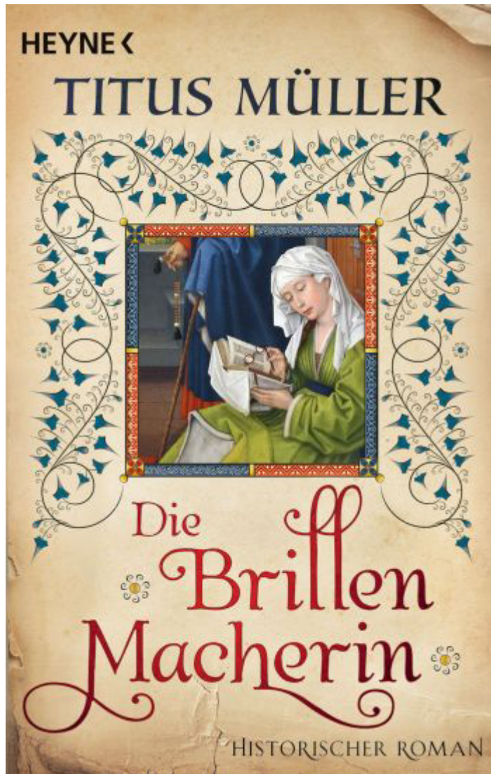
Titus Müller, Die Brillenmacherin, Heyne.

Von dem Dauertrend, irgendwelche absurden Berufsbezeichnungen als Romantitel zu verwenden, lasse ich mich inzwischen nicht mehr so schnell abschrecken – oft verbergen sich dahinter doch sehr vielseitige Geschichten. Auch in „Die Brillenmacherin“ geht es um weit mehr als die Herstellung von Augengläsern: Für die Verschwörung, in die Catherine gerät, sind die Lollardenbewegung und die Wycliff-Bibel mindestens genauso wichtig (und sie sollen irgendwann einen eigenen Artikel bekommen).